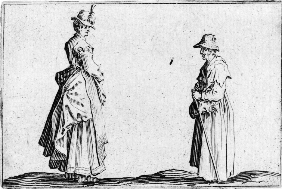
Donne di profilo di J. Callot, ca 1617, incisione, foto tratta da MeisterDrucke.